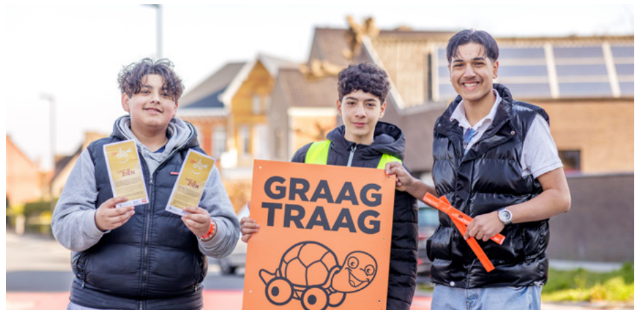
Actie Graag Traag in de Bergstraat, Oudenaarde